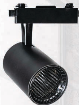
PTR 13 BL/BL