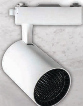
PTR 13 WH/BL