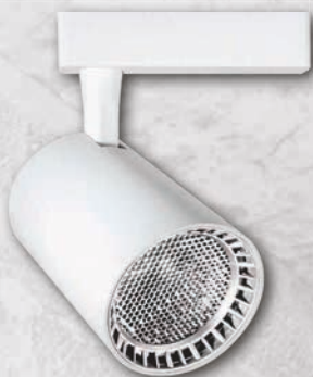
PTR 13 WH/WH