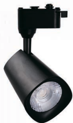
PTR 1615 15w BL