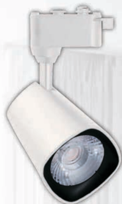
PTR 1615 15w WH