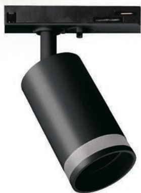
PTR 28 GU10 BL

ЦВЕТОВАЯ ТЕМПЕРАТУРА И МОЩНОСТЬ НА ВАШ ВЫБОР НАДЕЖНЫЙ И ЛЕГКИЙ АЛЮМИНИЕВЫЙ КОРПУС ПОДХОДЯТ ДЛЯ ДИММИРУЕМЫХ ЛАМП