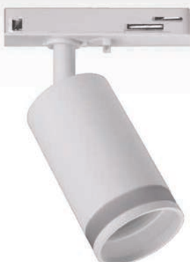
PTR 28 GU10 WH