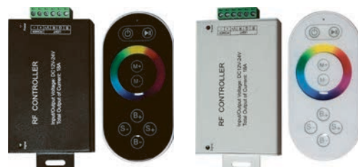
Контроллер RGB с пультом, черный