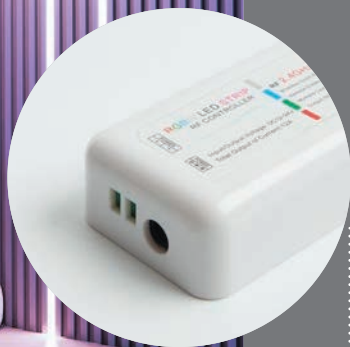
LD63 контроллер для управления режимами работы светодиодных лент

Трехканальный усилитель для монохромных и RGB светодиодных лент представляет из себя устройство, подключаемое в разрыв между отрезками ленты и позволяющее управлять одним контуром с помощью одного контроллера. Максимальный ток нагрузки составляет 24А (3x8А/CH), общая мощность подключаемой нагрузки 288Вт при используемом источнике питания с выходным напряжением 12В и 576Вт – при 24В.