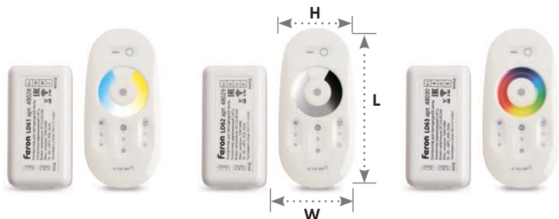
контроллер цветовой температуры для мультибелых лент