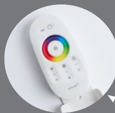
LD63 пульт для контроллера