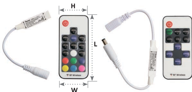
контроллер для RGB-лент