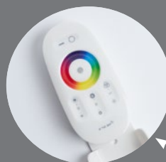
LD63 пульт для контроллера