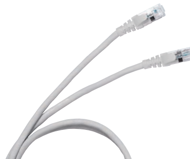
0 516 40