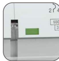
Окно реального состояния контактов с защитой от искр