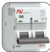
Литая лицевая панель