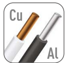
Возможна коммутация алюминиевым и медным проводником