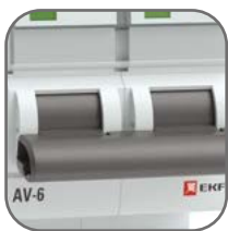
Механизм мгновенной коммутации (ММК)

Выключатели автоматические серии AV-6 EKF AVERES предназначены для оперативно-го управления участками электрических цепей, а также для защиты от токов перегрузки и короткого замыкания в административных, промышленных и жилых зданиях. Выключатели производятся в одно-, двух-, трех- и четырехполюсном исполнении. Номинальная наибольшая отключающая способность (Icn) 6000 А. Полный набор аксессуаров для расширения функций. Гарантийные обязательства 10 лет.