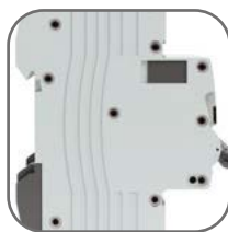
Жесткий корпус, 9 заклепок