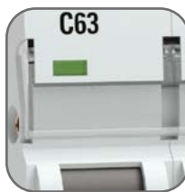
Удобное окно для маркировки цепи