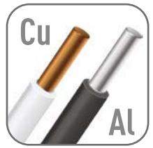
Возможна коммутация алюминиевым и медным проводником