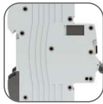
Жесткий корпус, 9 заклепок