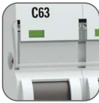
Удобное окно для маркировки цепи