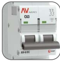
Литая лицевая панель