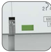
Окно реального состояния контактов с защитой от искр