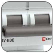
Механизм мгновенной коммутации (ММК)

Автоматические выключатели для постоянного тока AV-6 DC EKF AVERES предназначены для защиты электрических цепей постоянного тока от токов перегрузки и короткого замыкания, проведения тока в нормальном режиме и оперативных включений и отключений цепей постоянного тока. Полный набор аксессуаров для расширения функций. Гарантийные обязательства 10 лет.