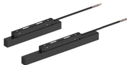
LB48 арт.41955/41956 (100/200W)

Трансформатор электронный (драйвер) LxWxH, mm (120/150x50x20)