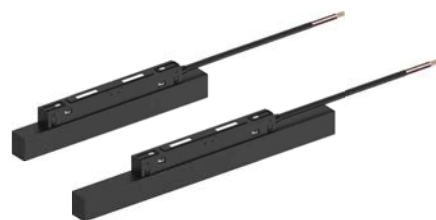
LB48 арт.41955/41956 (100/200W)

Трансформатор электронный (драйвер) LxWxH, mm (120/150x50x20)