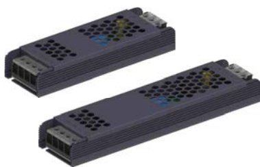
LB048 арт.41957/41958 (100/200W)

Трансформатор электронный (драйвер) LxWxH, mm (120/150x50x20)