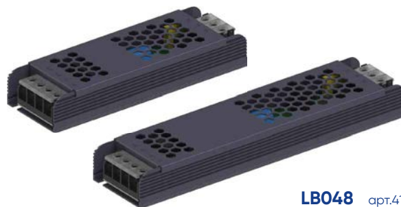
LB048 арт.41957/41958 (100/200W)

Трансформатор электронный (драйвер) LxWxH, mm (120/150x50x20)