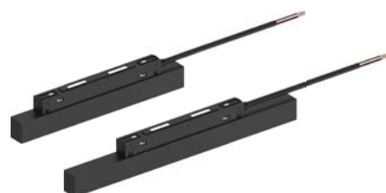
LB48 арт.41955/41956 (100/200W)

Трансформатор электронный (драйвер) LxWxH,мм (120/150x50x20)