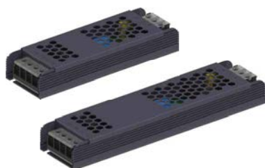
LB048 арт.41957/41958 (100/200W)

Трансформатор электронный (драйвер) LxWxH,мм (120/150x50x20)