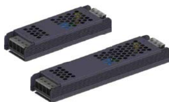
LB048 арт.41957/41958 (100/200W)

Трансформатор электронный (драйвер) LxWxH,мм (120/150x50x20)