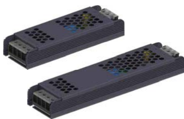
LB048 арт.41957/41958 (100/200W)

Трансформатор электронный (драйвер) LxWxH, mm (120/150x50x20)