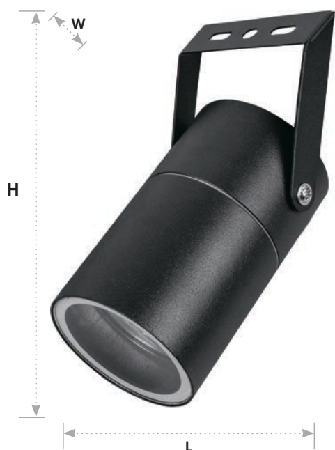
DH1703 арт. 48329