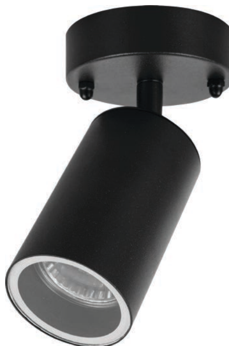
DH1704 арт. 48322