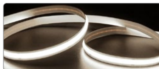
арт. 48264 4000K