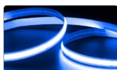
арт. 48267 синий