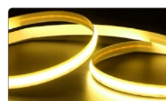
арт. 48269 жёлтый