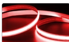
арт. 48266 красный