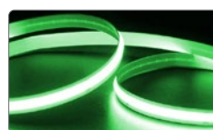
арт. 48268 зеленый