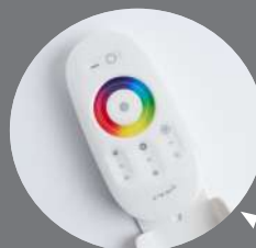
LD63 пульт для контроллера