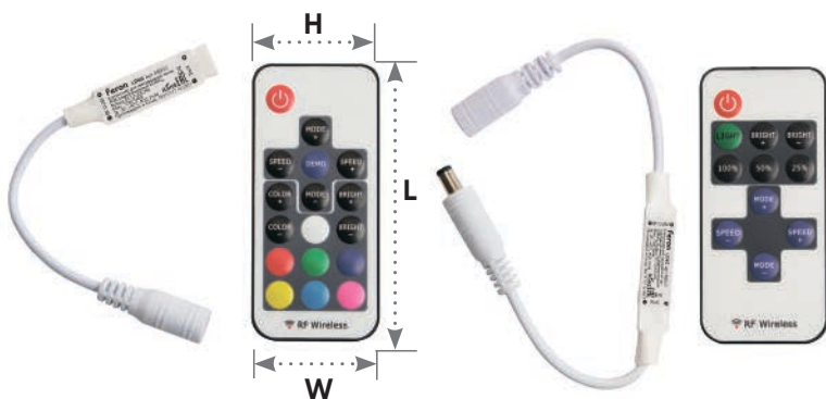
контроллер для одноцветных лент