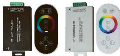
Контроллер RGB с пультом, черный