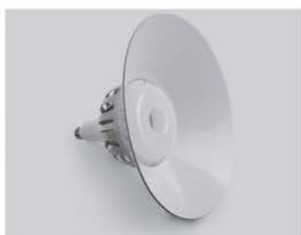
Лампа с отражателем

Светодиодные лампы LB-651 и LB-652 TM FERON являются эволюцией ретрофитов высокой мощности, заменяя и превосходя по ряду характеристик лампы накаливания, КЛЛ, ДРЛ, ДРИ и ДНАТ лампы. Предназначены для освещения складских и хозяйственных помещений, промышленных объектов, производств, спортивных залов и торговых залов в светильниках типа ЖСП, РСР, ГСП*, а так же без светильника.