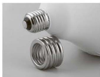
Универсальный цоколь-переходник входит в комплект