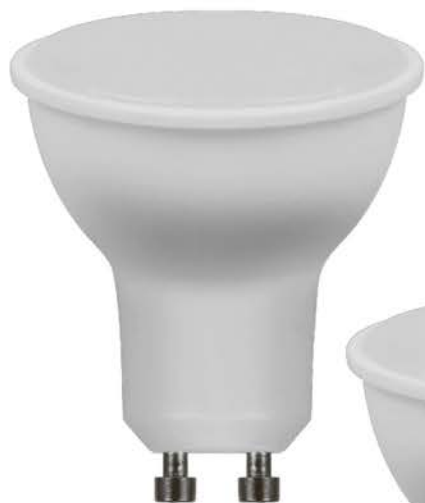
Арт. 38191, 38192, 38193