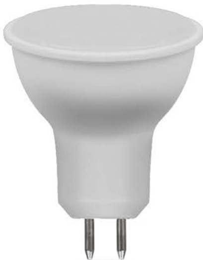
Арт. 38188, 38189, 38190

Новая модель лампы LB-960 13Вт от Feron с увеличенной мощностью и световым потоком, предназначена для использования в точечных светильниках и для замены галогенных ламп накаливания MR16.