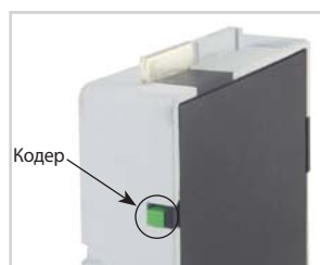
Кодер на обратной стороне сменного модуля (в комплект поставки не входит) показывает состояние сменного модуля.