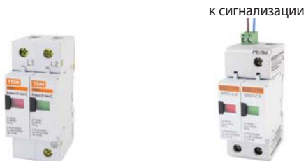
Стандартное основание ОПС без возможности удаленного мониторинга состояния модулей