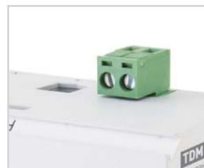
Разъем 2EDG позволяет подключать провода сечением до 2,5 мм 2 к 1НО контакту.