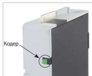
Кодер на обратной стороне сменного модуля (в комплект поставки не входит) показывает состояние сменного модуля.