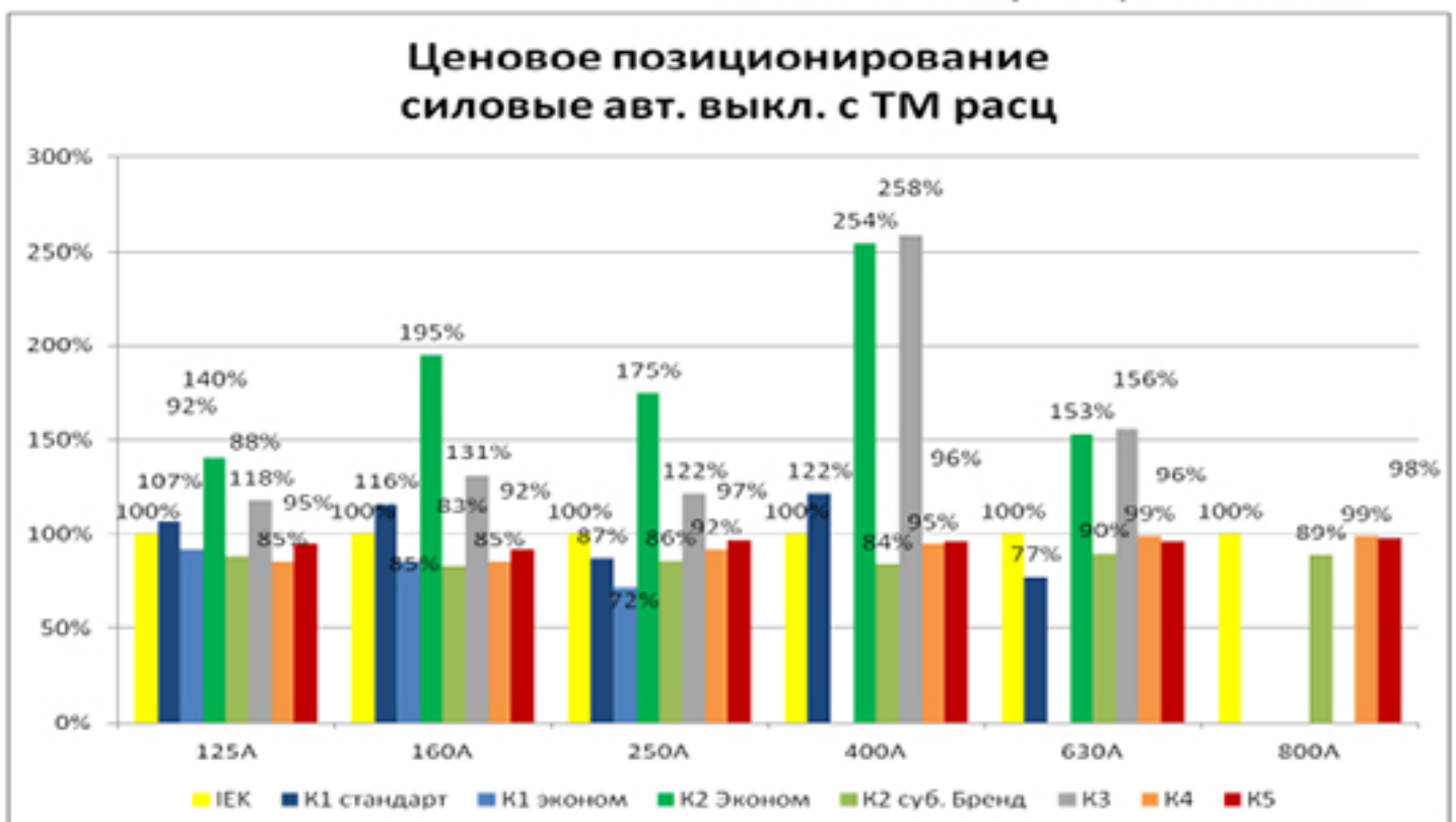
Ценовое позиционирование силовые авт. выкл. с ТМ расц