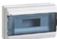
Серия КМПн IP55