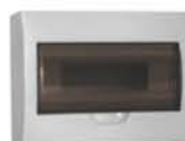
Серия ЩРН(В)-П LIGHT