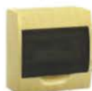
Серия ЩРН-П в эко-стиле