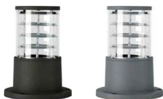
DH0800 арт. 41915/41916