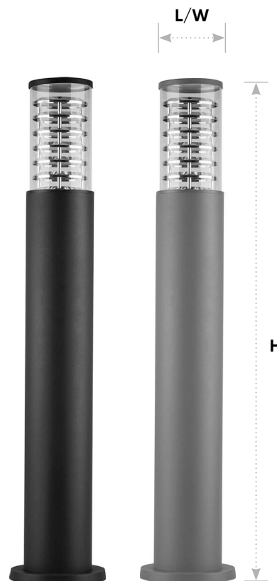
DH0805 арт. 06302/06303