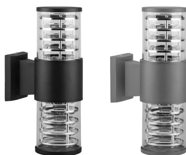
DH0802 арт. 06298/06299