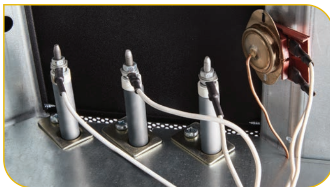
Защита от перегрева