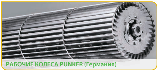
РАБОЧИЕ КОЛЕСА PUNKER (Германия)

С индивидуальной балансировкой для снижения биений и вибраций