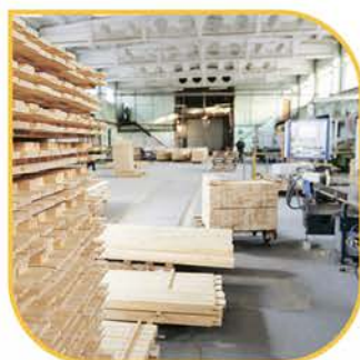
ЦЕХА И ПРОИЗВОДСТВА