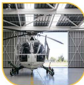
ДОКИ И АНГАРЫ