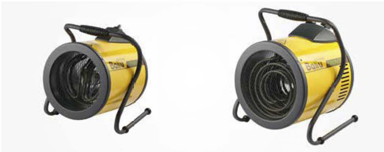
ВНР-Р-3 / ВНР-Р-5