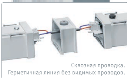
Сквозная проводка. Герметичная линия без видимых проводов.