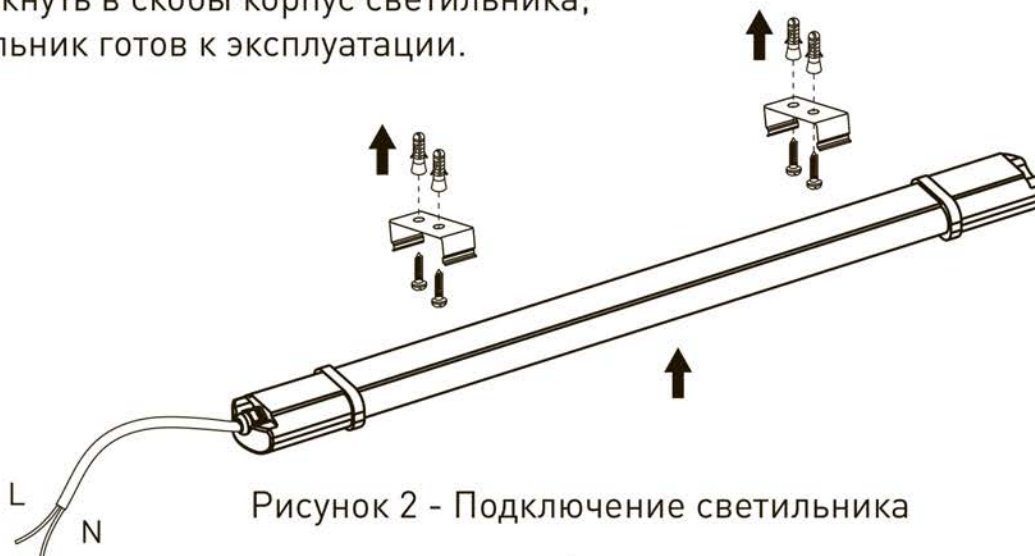
Рисунок 2 - Подключение светильника