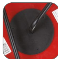
Усиленная шпуля катушки