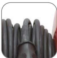
Кабель в резиновой оболочке (КГ). Длина: 30, 40, 50 м