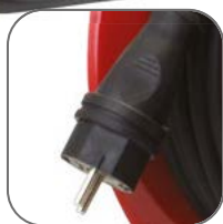
Каучуковая разборная вилка