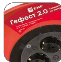
Катушка из металла толщиной 0,8–0,9 мм