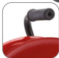
Рама из металлической трубы с резиновой рукояткой

Удлинитель на металлической катушке «Гефест 2.0» EKF PROxima могут использоваться на строительных площадках, для подключения энергоёмких потребителей в гаражах и на приусадебных участках, в том числе сварочной аппаратуры, перфораторов, электропил. Надёжный кабель КГ в резиновой изоляции выдержит как механические нагрузки, так и суммарную мощность подключенных потребителей до 3,5 кВт.