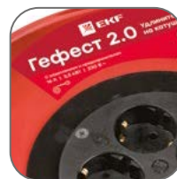
Катушка из металла толщиной 0,8–0,9 мм