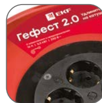
Катушка из металла толщиной 0,8–0,9 мм