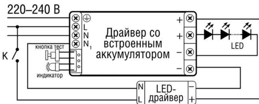
Схема подключения БАП в светильнике NLP-S2-A

Сделано в России. Изготовитель: ООО «Каскад» 141607, РФ, Московская обл., г.о. Клин, г. Клин, тер. Клинавтотранс, д. 4/1, стр. 2