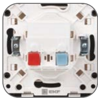
Основание из пластика, не поддерживающего горение

Серия «Стокгольм» это новое слово в дизайне электроустановочных изделий. Вы по достоинству оцените уровень комфорта и тактильные ощущения, при управлении светом и при подключении электроприборов у вас дома. Скандинавский дизайн надежно стал ассоциироваться с лаконичностью, но при этом с максимальной функциональностью и удобством пользования. Эти же принципы мы учитывали при разработке серии «Стокгольм». Никаких броских цветных пятен, лишь тонкие линии в цвет Вашего интерьера на белом матовом фоне. Для самых изысканных интерьеров мы предлагаем серию Стокгольм в черном цвете с использованием рамок из натурального металла. Механизмы серии Стокгольм используют автоматические клеммы для удобства подключения проводников. Устанавливать механизмы в ряд стало еще проще благодаря технологии мозаичной стыковки суппортов, а универсальные рамки позволяют размещать механизмы и вертикально, и горизонтально.