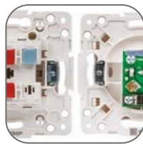
Уникальная стыковка суппортов