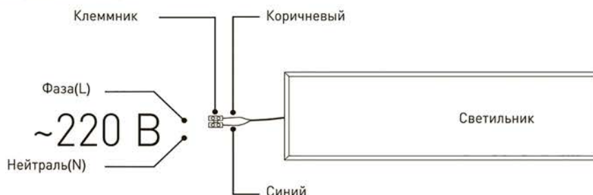
Рис.1. Схема подключения светильника к сети 220В.

3.3.2. Этот провод необходимо подключить к проводу источника питания с помощью внешнего клеммника (в комплект не входит) в соответствии со схемой, изображенной на рис.1;