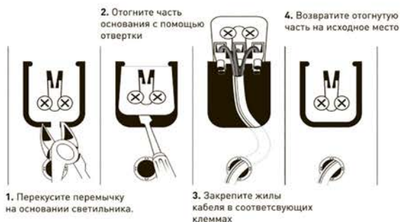
Рис.2. Схема подключения светильника SPO-6-36 к сети 220В.

3.3.3. После проверки правильности подключения можно включать сетевое напряжение.