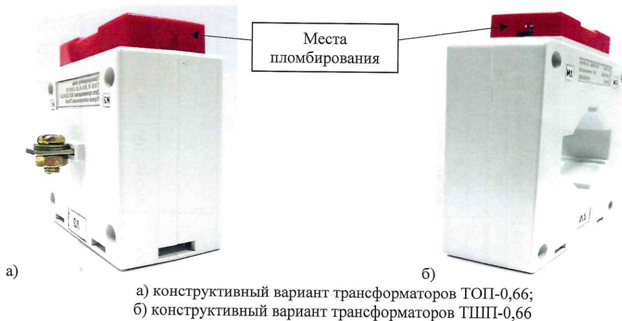
Рисунок 2 - Места пломбирования от несанкционированного доступа