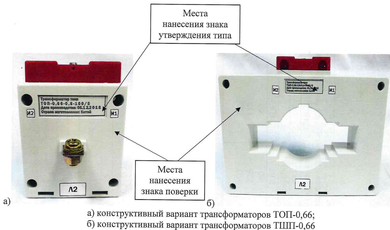
Рисунок 1 – Общий вид трансформаторов с местами нанесения знака поверки и знака утверждения типа