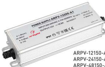
ARPV-12150-A1 ARPV-24150-A1 ARPV-48150-A1 ARPV-12200-A1 ARPV-24200-A1 ARPV-48200-A1