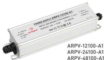
ARPV-12100-A1 ARPV-24100-A1 ARPV-48100-A1