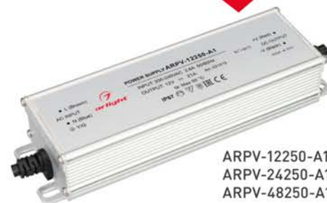
ARPV-12250-A1 ARPV-24250-A1 ARPV-48250-A1