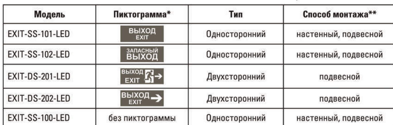
Таблица 3. Модификации светильников

* Для светильников EXIT-SS-100-LED пиктограмма приобретается отдельно. Для остальных светильников пиктограмма идет в комплекте и ее замена невозможна!