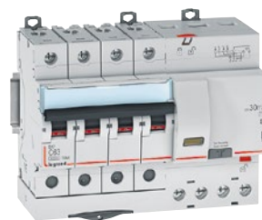
4 111 92