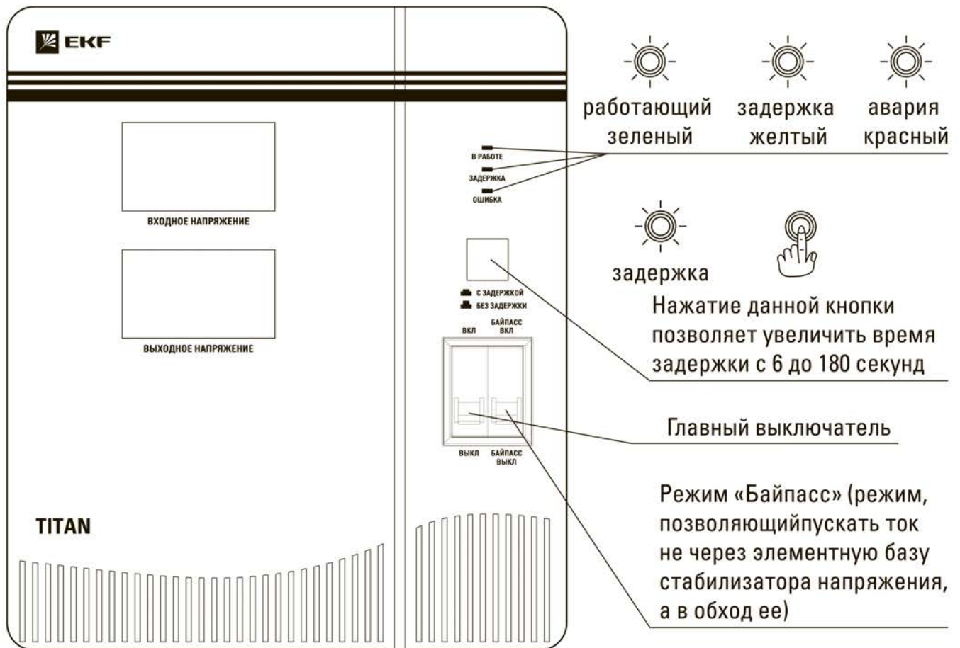
Рис. 3 Внешний вид стабилизатора F-8000/10000/12000