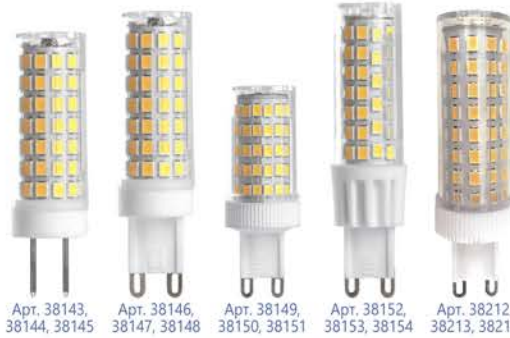
Арт. 38143, 38144, 38145