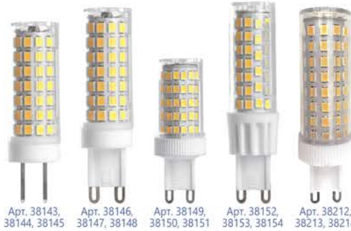
Арт. 38143, 38144, 38145