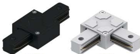
LD1006 Арт. 41735