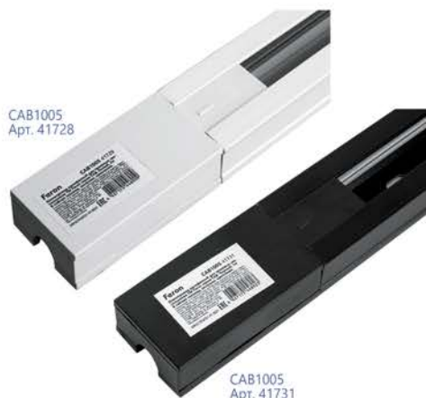
CAB1005 Арт. 41728