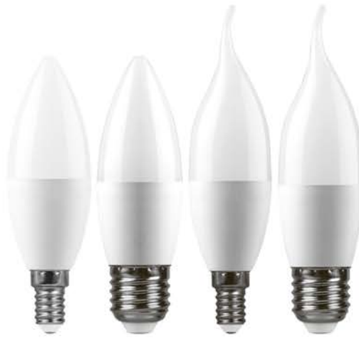
Арт. 25941, 25942, 25943