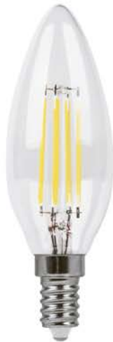
Арт. 25956, 25958, 38006, 38008