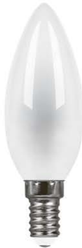
Арт. 25955, 25957, 38005, 38007

Светодиодные лампы FILAMENT LB-73 и LB-713 TM FERON – идеальное решение для хрустальных люстр и открытых светильников, в которых источник света является частью дизайна. Применяются как для общего, так и для декоративного освещения.