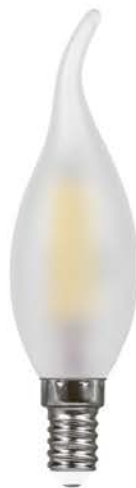
Арт. 25959, 25961, 38009, 38011

Светодиодные лампы FILAMENT LB-74 и LB-714 TM FERON – идеальное решение для хрустальных люстр и открытых светильников, в которых источник света является частью дизайна. Применяются как для общего, так и для декоративного освещения.