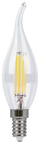
Арт. 25960, 25962, 38010, 38012