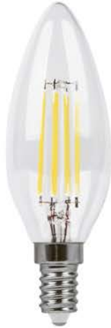
Арт. 25956, 25958, 38006, 38008