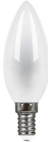
Арт. 25955, 25957, 38005, 38007

Светодиодные лампы FILAMENT LB-73 и LB-713 ТМ FERON – идеальное решение для хрустальных люстр и открытых светильников, в которых источник света является частью дизайна. Применяются как для общего, так и для декоративного освещения.