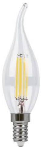
Арт. 25960, 25962, 38010, 38012