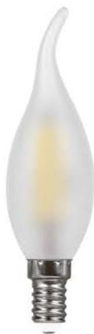
Арт. 25959, 25961, 38009, 38011

Светодиодные лампы FILAMENT LB-74 и LB-714 ТМ FERON – идеальное решение для хрустальных люстр и открытых светильников, в которых источник света является частью дизайна. Применяются как для общего, так и для декоративного освещения.